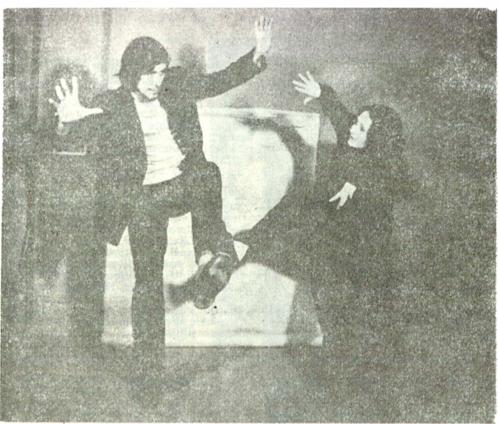
În repetiții cu Bolnavul închipuit de Molière la Naționalul ieșean

de grație. Nu idealizez. Oricare dintre colegii mei spune același lucru. A fost perioada cea mai pasionantă din viața mea. În acei ani m-am format, de fapt. Problemele teatrului mi se puneau într-o lumină nouă, care mă deconcerța. În ciuda lecturilor, a experienței de teatru, aveam un provincialism care l-a făcut pe Ion Olteanu să nu aibă încredere în mine. M-a chinuit foarte mult în anul întâi. Zicea că arăt ca o balerină. Mă puneă să mă urc pe scenă și, dacă se întâmpla să mă împiedic, le spunea colegilor: „Nu așa să faceți teatru!” Atunci am suferit, am plins, mai târziu am înțeles că avea dreptate. Profesorul meu nu a putut să citească în mine, dar nici eu nu mă cunoșteam îndeajuns. Atitudinea lui m-a făcut să sufăr, m-a obligat să mă caut și să mă descopăr. Aceasta mi-a dat profunzime. Surprins că la materiile teoretice aveam numai note de zece, Ion Olteanu a avut probitatea să-mi spună că, deși nu crede în vocația mea regizorală, îmi lasă libertatea să fac ce vreau la clasă, și la sfârșit îmi va comunica verdictul lui. Și așa a făcut, fapt pentru care am să-i rămân recunoscătoare toată viața. După examenul cu Pictură pe lemn de Ingmar Bergman m-a felicitat și mi-a spus că rareori auzise atâtea lucruri bune despre un examen al unui elev de-al lui. Știam