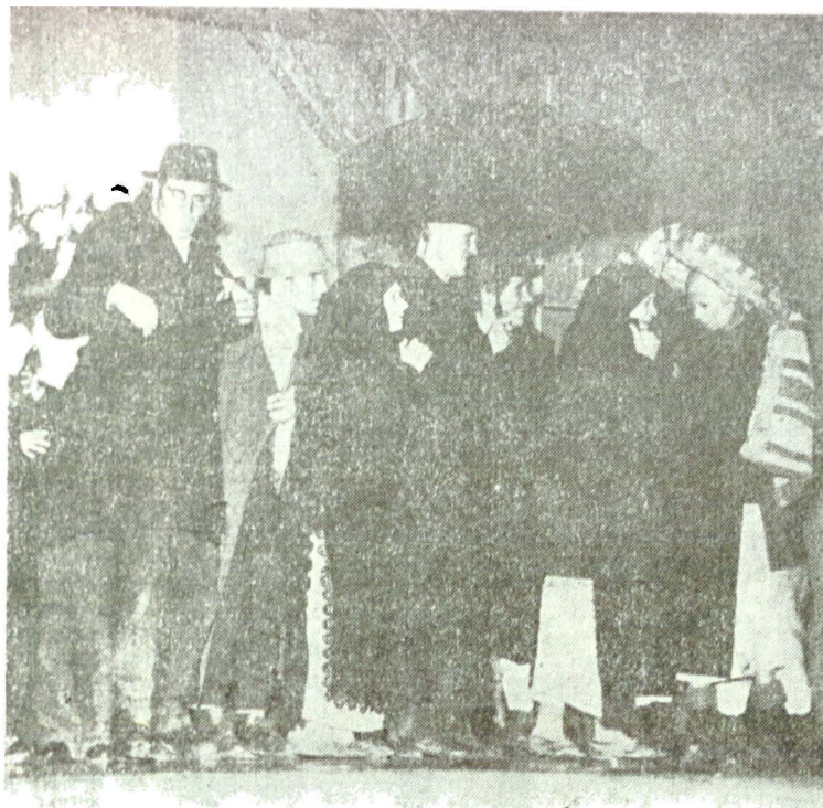
Niște țărani, scenariu teatral de Cătălina Buzoianu după Dinu Săraru