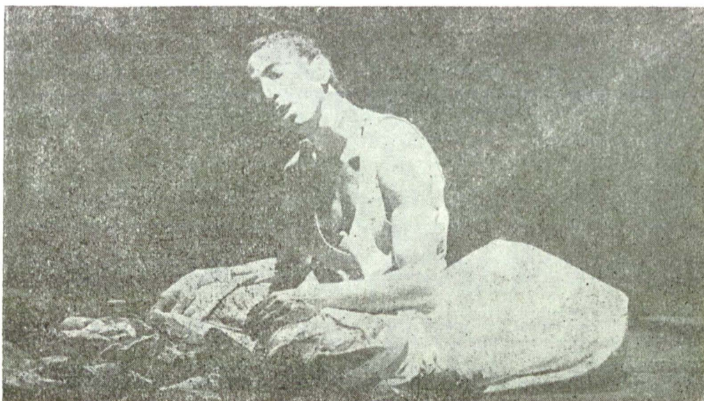
Visul unei nopți de vară de William Shakespeare (Teatrul din Beer-Sheva)