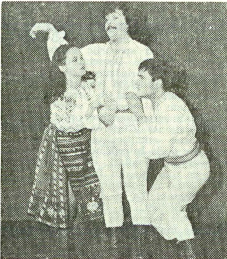
Scenă din spectacolul „Tot iubit-u-are-un haz...”