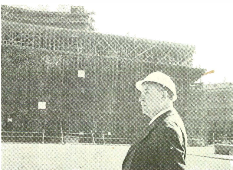
Pe șantierul noului Teatru Național, 1969