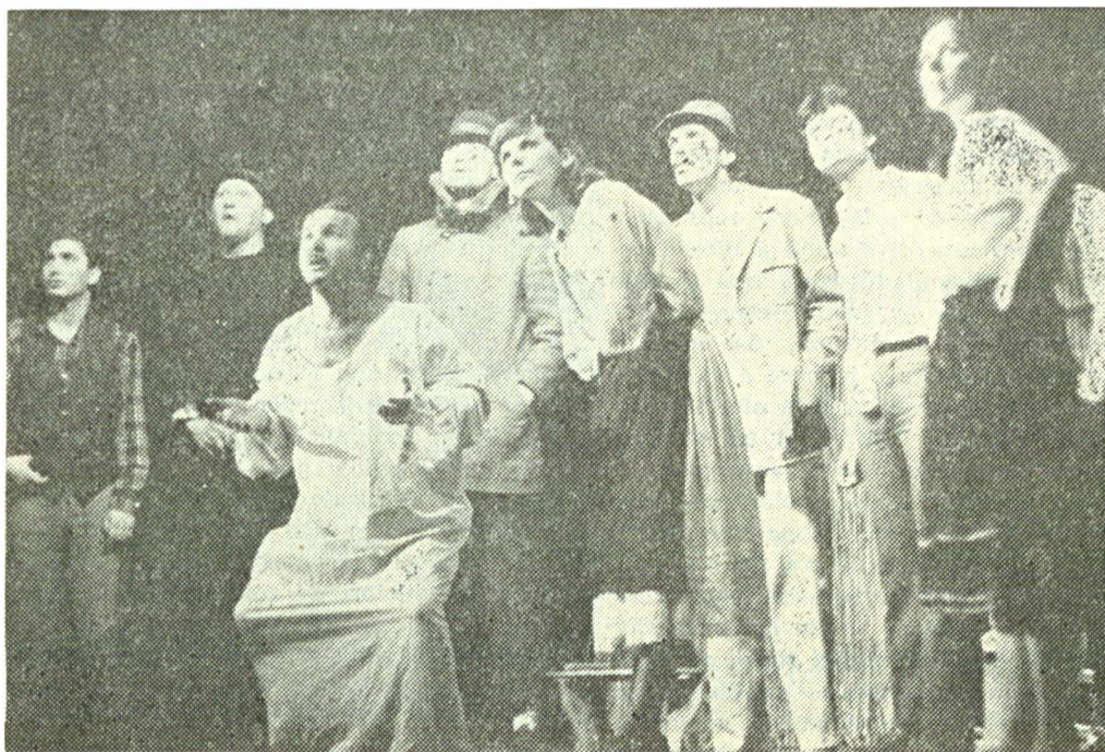
Spectacolul „Rinduiei“, după Marin Sorescu

trupel, fără a uita să subliniem suculența comicalului, lipsit de orice îngroșare ostentativă, și subtilitatea redării spiritului sorescian al textului, reprezentația este o convingătoare demonstrație de artă autentică și de adevăr artistic. Ar mai fi de adăugat că spectacolul are nu numai o «Indrăcită» vervă de joc și o alertețe de spirit oltenească, ci și o reală și particulară adâncime filozofică, dată de pricepera transfigurării scenice a nu mai puțin sorescianului sentiment al trecerii și petrecerii noastre prin această viață“.