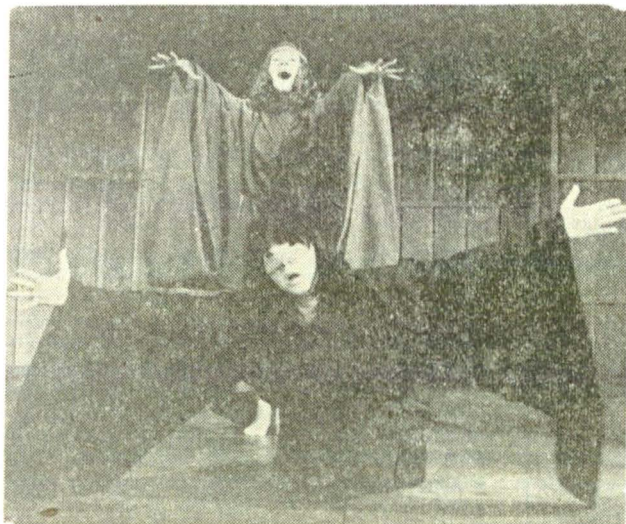
Scenă din „Omul cel bun din Si-Ciuan” de Bertolt Brecht