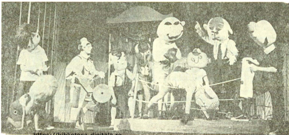
Scenă din „Afară-i vopsit gardu’, înăuntru-i leopardu” de Alecu Popovici