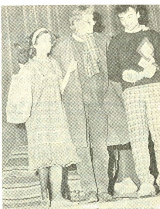
„Mansarda” de Dan Tărchilă, în interpretarea studenților Institutului de construcții

În Miresme de santal , trei studenți și un student de la medicină ne-au înfățișat, pe o inteligent articulată temă din lirica actuală chineză, un imn închinat dreptului de a iubi. Detalii vădînde cultură și bun-gust, costume elegante de mătase neagră, cu dragoni aurii, bețișoare de santal aprinse, plante ornamen-