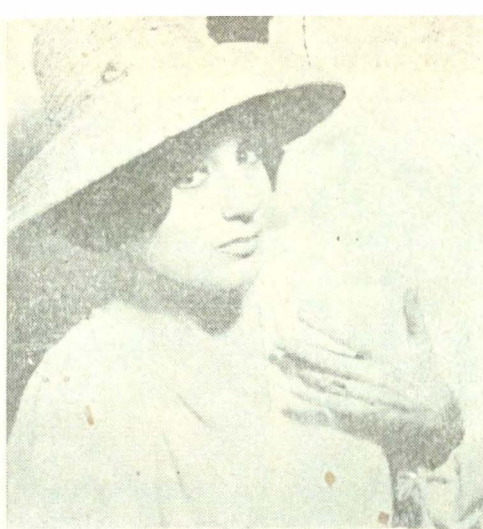
Madame Vintilă in „Jocul de-a vacanța” de Mihail Sebastian (1971); în „Căsătoria” de Gogol (1976); în „Căruța cu paiațe” de Mircea Ștefănescu (1980)