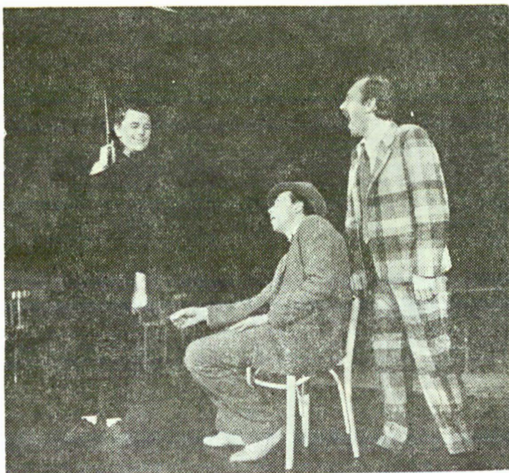
Scenă din „ Acești nebuni fățarnici ” de Teodor Mazilu; regia, Nicolae Caranfil

De asemenea, cu o muncă intens susținută de un real profesionalism — în primul rînd din partea lui Tudor Măărăscu, adaptatorul și regizorul textului —, s-a realizat în 1986 Slugă la doi stăpîni de Carlo Goldoni.