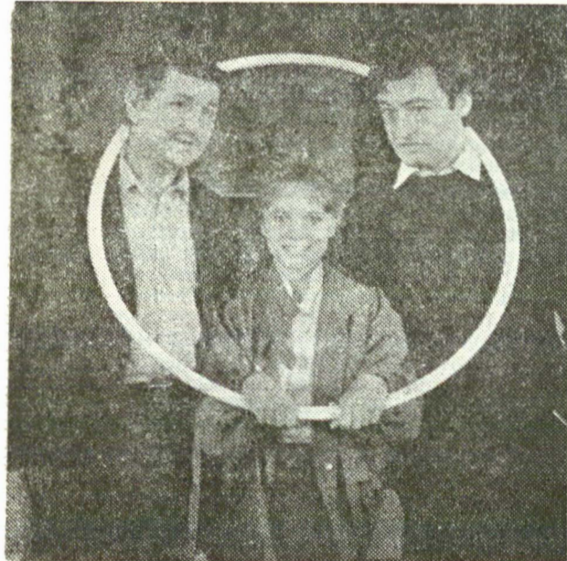
Scenă din „Așteptam pe altcineva” de Paul Ioachim; regia, Tudor Măărăscu

De asemenea, vom monta Pescărușul de Cehov, propunându-ne sondarea universului realist-magic al acestei capodopere, școală de înaltă exigență pentru orice colectiv teatral.