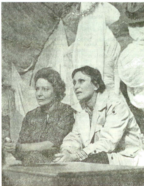
Scenă din „Ana-Lia” de Dina Cocea ; regia, Dominic Dembinski