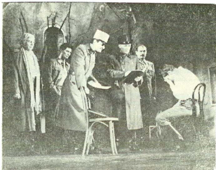
„Ultimul bal” de Ion Brad și Dan Micu după Liviu Rebreanu, Teatrul „Nottara”