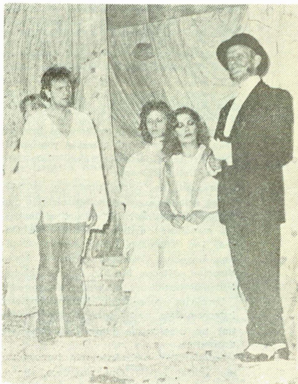
Scenă din „Arheologia dragostei” de Ion Brad

Divers și bogat, așa cum ne-am obișnuit să-l oferim publicului pe care ni l-am format (foarte eterogen, din punct de vedere al compoziției sociale, ca vîrstă predominînd tineretul), repertoriul nostru cuprinde foarte multe reluări. Sînt spectacole pe care le jucăm de ani de zile.