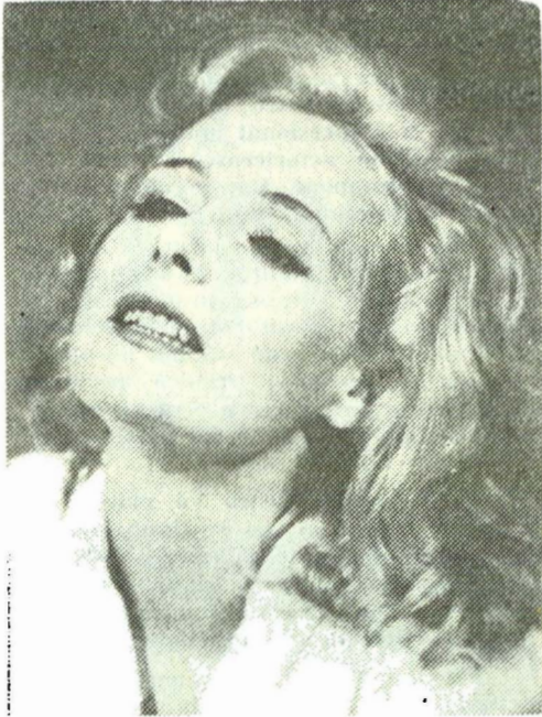
Actrița, în „Geniul și Zeița” de Terry Johnson

a meritat să aștept cite doi ani pentru asemenea roluri grele, interesante, excelente. Nu este important în cariera unui actor să realizeze ușor rolurile. Mie îmi place să muncesc și să obțin ceva deosebit. Indiferent ce îți spune, în general sint nemulțumită de mine și cred că e loc de mai bine. Oricât de mulțumitor se încheie munca la un spectacol în care am ceva important de făcut, mă simt răscolită, parcă aș vrea să iau totul de la început, altfel, eventual mai bine.