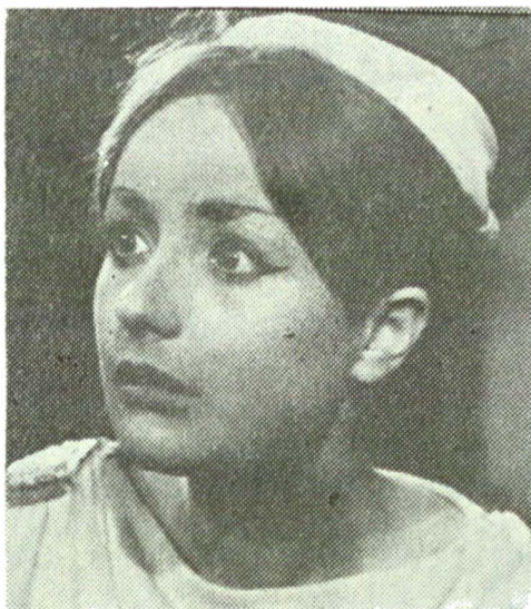
Rhea, în „Romulus cel Mare” de Fr. Dürrenmatt (la Teatrul Bacovia din Bacău)