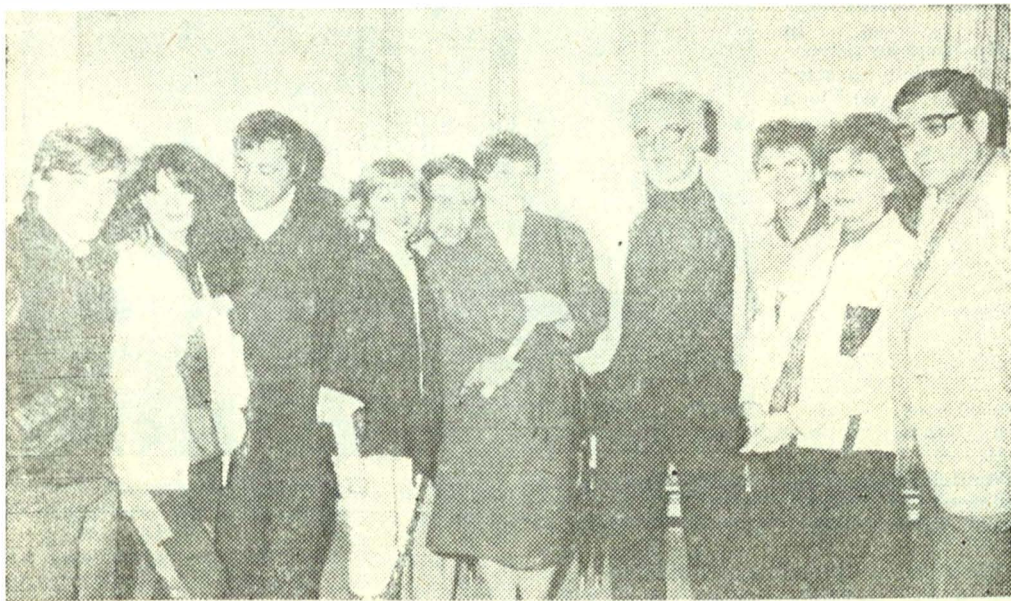
Un început de drum...