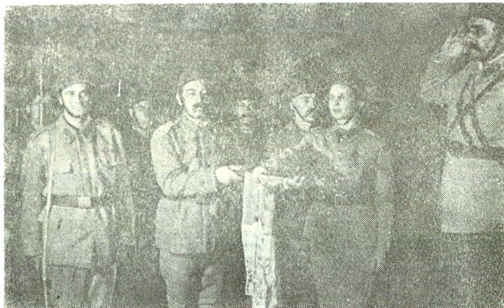
„Ecaterina Teodorescu” de Nicolae Tăutu, pe scena Teatrului Armatei din București

Tăutu, cunoscând direct împrejurările în care a murit eroic logodnicul Ecaterinei Teodorescu, voluntarul Gheorghe Pănoiu, în luptele din toamna anului 1944, la Oarba de Mureș, se pasionează de biografia cercetăsei apoi sublocotenentului Ecaterina Teodorescu, căzută în noaptea de 22/23 august 1917 pe platurile Pănoiuului.