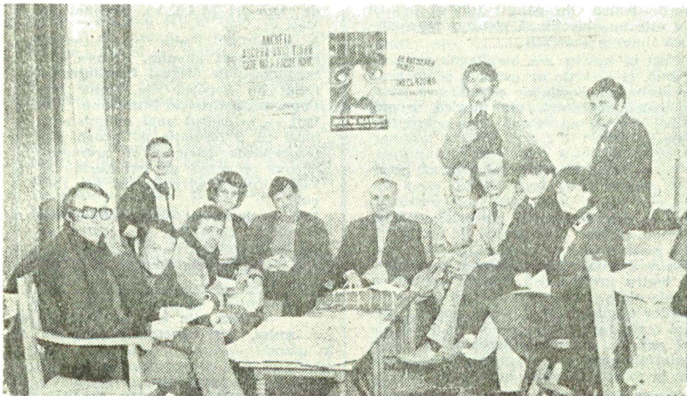
Repetiție la masă...

57 de premiere (inclusiv secțiile de estradă și păpuși)