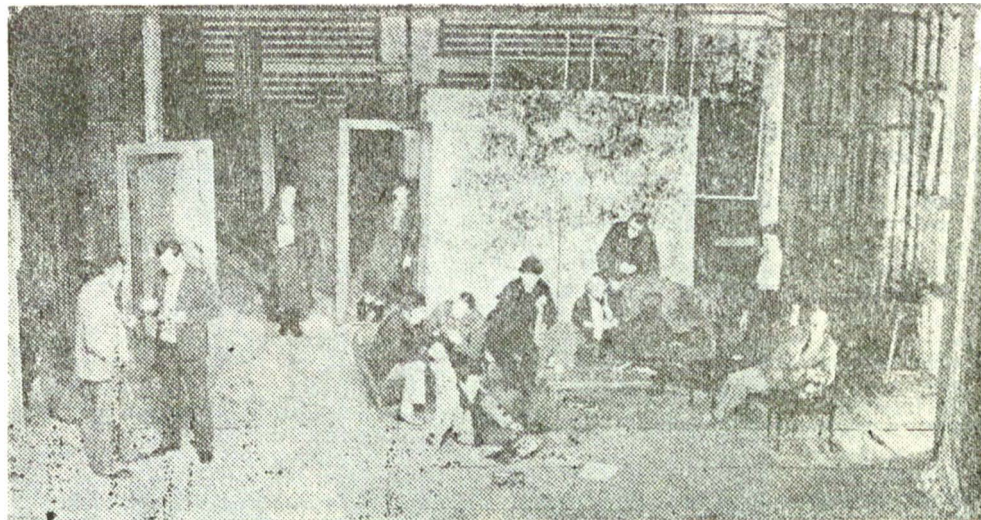
Se naște un nou spectacol...