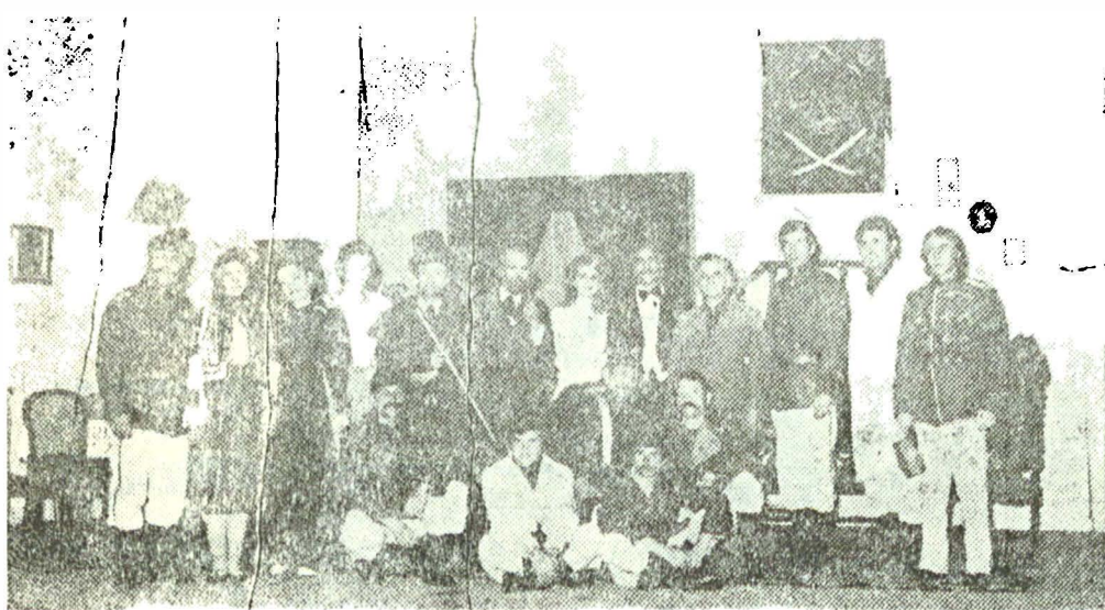
Interpreții piesei „Șoimii” de Petru Vințilă, regia Cristian Munteanu, stagiunea 1976—1977