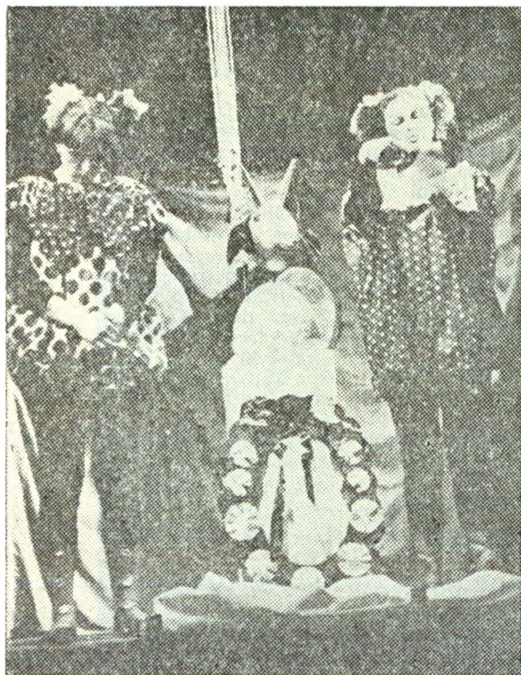
„Aventurile lui Talion” de Liviu Steciuc, după Călin Gruia, Teatrul de păpuși din Brașov

producții care se mărgineau doar să relateze, mai mult sau mai puțin coerent și aplicat, o poveste (și ea, la rîndul ei, mai mult sau mai puțin inspirată) — calea pe care a pornit Kovacs Ildiko are măcar meritul ieșirii din neutritate , spre a avansa un mesaj clar.