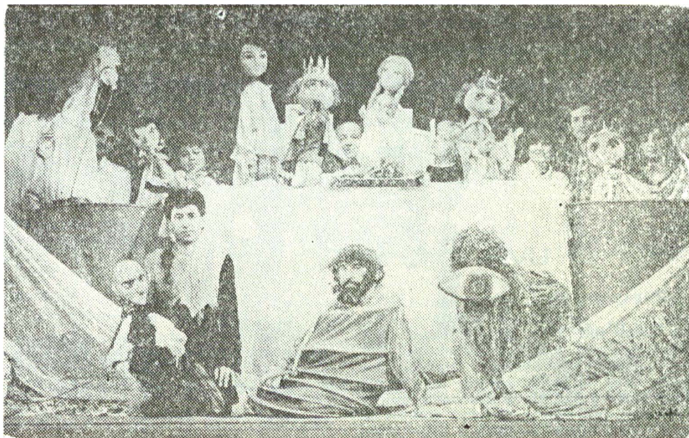
„Harap Alb” de Radu Popovici după Ion Creangă, Teatrul de păpuși „Ciufulici” din Ploiești