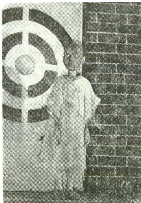
„Păpușa de lemn“ sau „Cazul Pinocchio“ în scenografia lui Dan Frățicu

— Și, astfel, ceea ce e doar posibil dar nu și probabil devine un fel de realitate „nreală“, neintimplată, dar