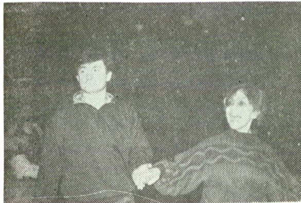
Ion Caramitru și Ileana Predescu — Jucind, sau trăind ?