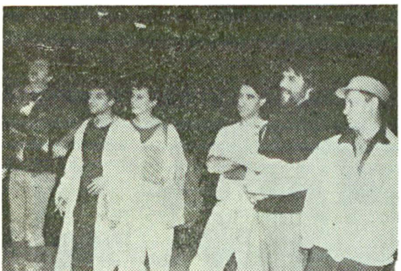
„Dacă sînt mulți, înseamnă că au curaj...” (Pirandello)