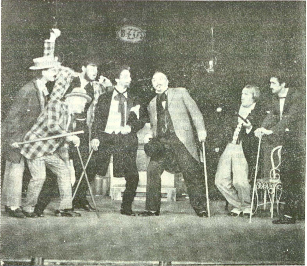
„O scrisoare pierdută“ de I. L. Caragiale

Zi friguroasă, cu cer închis, plumburiu, ca în stanțele înfiorate ale lui Bacovia. În fața teatrului, un șir de afișe cu mai multe titluri, din care încerc să aflu ce se poate vedea în cele câteva zile de popas băcăuan. Nu reușesc ...pe afișe nu scrie și data reprezentației. Încerc alături, la agenția teatrală. Nu înțeleg mare lucru; pe niște plăcuțe, care ar trebui să marcheze zilele săptămânii, un singur titlu — titlul unui spectacol al teatrului din Piatra Neamț. Și teatrul din localitate nu joacă nimic în săptămâna respectivă? Peste zece zile repet deplasarea. La agenția teatrală, același titlu al colectivului din Piatra Neamț — pe afișe, în sfârșit,