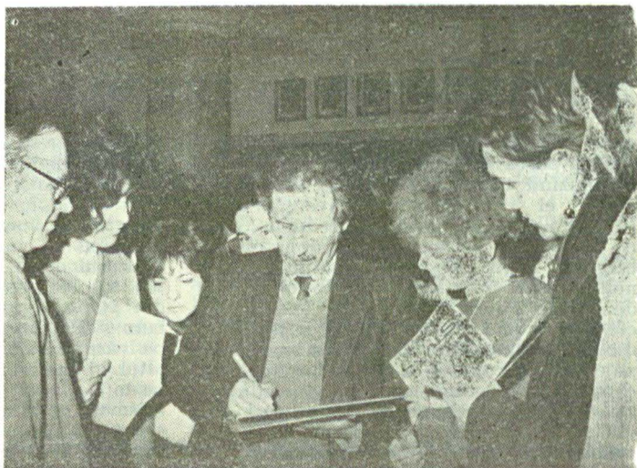
Poetul și dramaturgul Marin Sorescu dînd autografe cititorilor