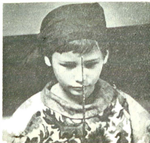
La Shakespeare și copiii mici visează regate