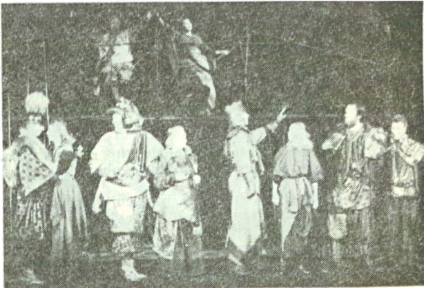
O piesă „serioasă” la Teatrul de Comedie