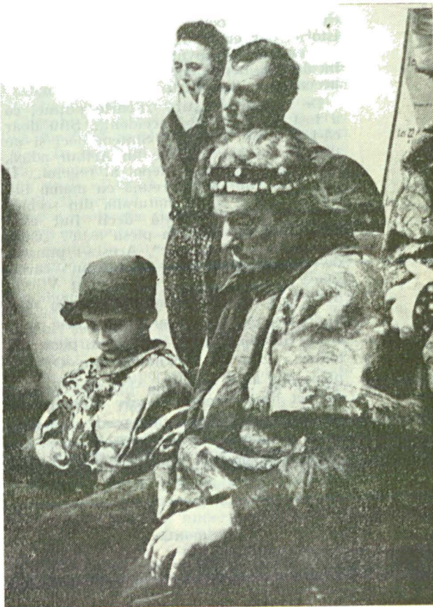
„Regele” și... colegii ascultînd, în culise, vocile scenei

Ca bastard-purtător de cuvânt al autorului, ce-ai reținut din acest Rege Ioan ? O mulțime de lucruri, că tragem de mult la premiera asta și ne-am băgat pînă în gît în istoria Angliei, în scrisul lui Shakespeare, în tot felul de incurcăături. Nu vreau să fac pe intelectualul... Nici nu pot să te oblig. Dar fii atent: un geniu nu se incurcă în mărunțșuri! Mie îmi spui? Nu, despre Shakespeare vorbesc: în piesă el pomenește de gloanțe, de tunuri, deși praful de pușcă va fi inventat o sută de ani mai târziu, în același timp însă, în replica mea din II, 1, 561—598, vorbește despre „bani”, „marfă”, „bunuri”, „profit”, toate incluse în „Commodity” — o genială disertație de economie politică