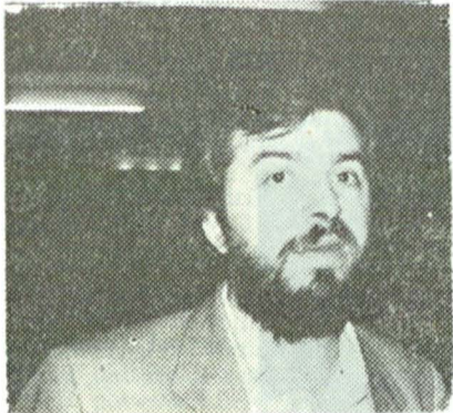
Regizorul Gelu Colceag despre „Turandot“