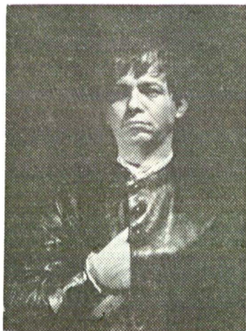
Conchistador, descoperitor de lumi, Cristofor Columb. În evocarea scrisă pentru scenă de M. de Ghelderode. Debut în Teatrul „Nottara”, 1968.