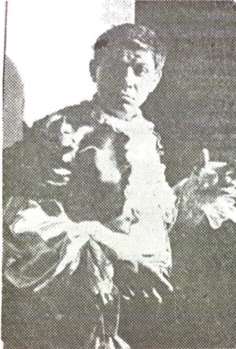
Cu chipul lui Sganarelle, erou comic, creat de Molière în Căsătoria silită. Debut în Teatrul Tineretului din Piatra Neamț, 1964,