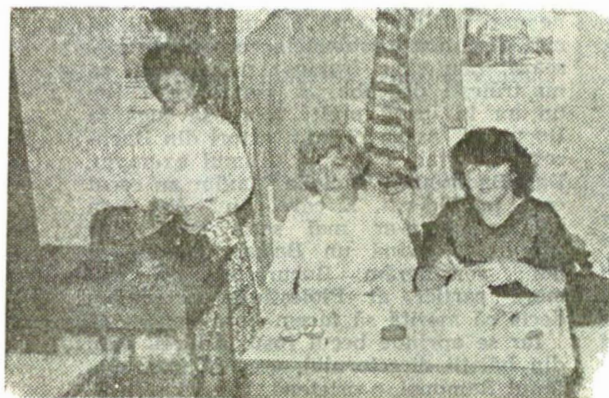
Noi îi îmbrăcăm (croitoria teatrului)— poză de grup