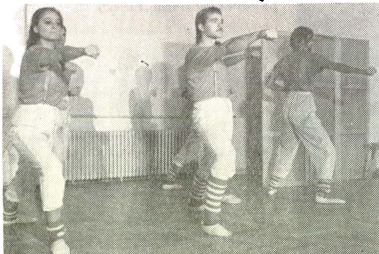
Grupul „Facies” al Casei de Cultură a Tinere- tului din Botoșani într-un recital plin de dina- mism și imaginație : „Secvență” japoneză...