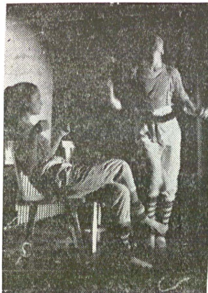
Grupul de balet „Contemp” într-un recital de înaltă ținută artistică