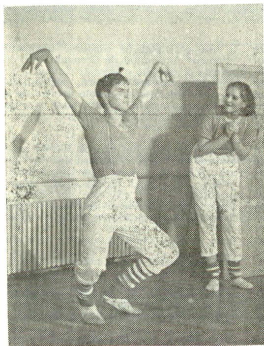
Altă „secvență” japoneză