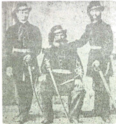
Garda orășenească în 1866

bil. În același timp, autorul scapă de o capcană întinsă de opera satiricului mai tuturor comentatorilor. Inteligența critică, abordând uriașul număr de exegeze dedicate marelui scriitor, riscă să se rătăcească în complicatul labirint al asocierilor și disocierilor de punctele de vedere anterioare. Mircea Iorgulescu, punându-le între paranteze husserliene, își protejează talentul de epuizarea în aprobarea sau respingerea ideilor altora. Un alt mijloc de autonomizare a lumii lui Caragiale îl reprezintă identificarea experienței de lectură cu experiența de viață. Sau, mai precis, cu experiența de călătorie. Gesturile autorului, mărturisite în prefață, sint de martor într-o lume străină „...în lumea lui Caragiale am pătruns ca un călător într-un univers complet străin. Ca un explorator sau ca un naufragiat într-o lume necunoscută, în multe, foarte multe privințe neverosimilă, stranie, totuși reală, existentă“. El străbate această lume de-a lungul și de-a latul, face cunoștință cu locuitorii ei cei mai de seamă, în parte la principalele evenimente și, asemenea unui Dinicu Golescu exeget, întors acasă, purcede la redactarea impresiilor „Revenit la îndeletnicirea mea, ca dintr-un vis ori ca din-