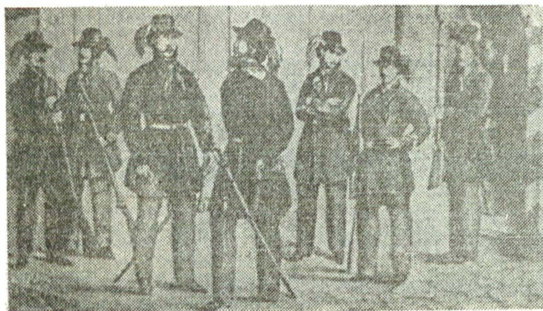
Garda cetățenească română (litografie), 1866

tr-o călătorie pe alt tărîm, am încercat să o descriu, să-i analizez anumite caracteristici, să-mi pun în ordine observațiile, să le interpretez.“ Ca în orice reportaj, fie el și critic, accentul cade pe relatare. Rătăcind prin lumea lui Caragiale, Mircea Iorgulescu notează minuțios cele întâlnite în cale. Nu sint uitate nici sentimentele provocate de contactul cu personaje și întâmplările mai semnificative : „...în lumea lui Caragiale ești ispitit la tot pasul să rizi în hobote, ride și ea, dar la rădăcina risului se află spaîma. Rîzi, rîzi, rîzi, și dintr-o dată, cu vorba unui personaj de acolo, «te-apucă groaza, monșer, groaza !...».“