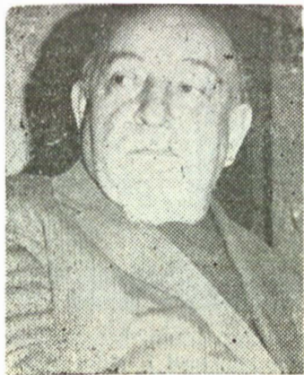
Paul Everac în dublă ipostază de autor și regizor