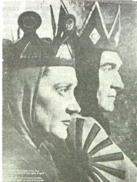
Maria Casarès și Jean Vilar (1954) un „Macbeth” istoric