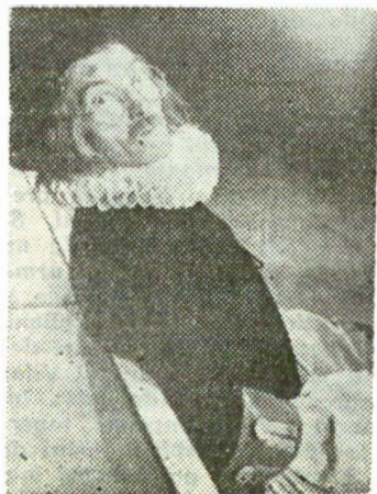
Jean Vilar în „Avarul” (1952)