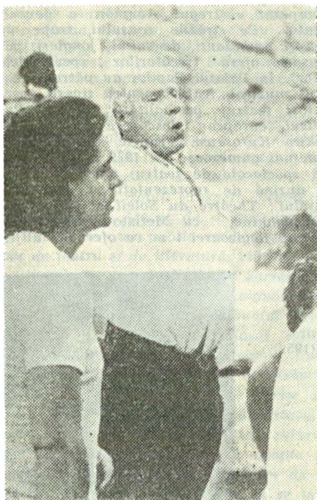
Peter Brook, creatorul monumեն- talei „Mahabharata” (1985) : gran- dulosul spectacol al repetiției

popular, căci Avignon este un loc lipsit de minciună, în care totul este redat din nou oamenilor” — scria Roland Barthes în 1954.