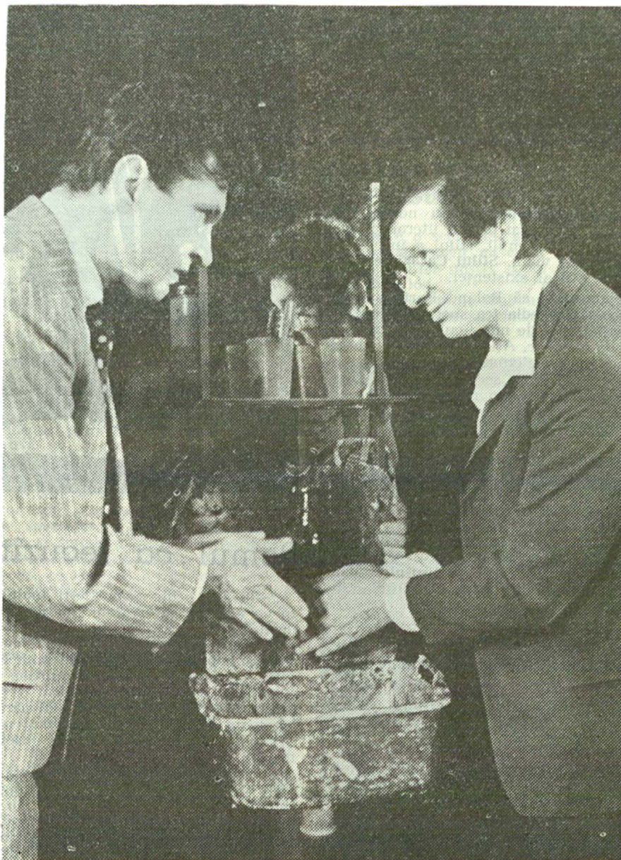
....„ÎNTR-O DIMINEAȚĂ” de Mihai Ispirescu la Teatrul „Nottara”