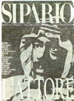
SIPARIO (Italia), nr. 488/1988