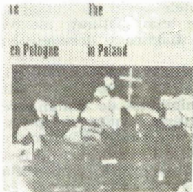
LE THEATRE EN POLOGNE (THE THEATRE IN POLAND), august, septembrie, octombrie, 8-10, 1988

revistei) ● Zinaidei Raikin, vedetă a teatrului lui Meyerhold, soție a marelui director de scenă, i se dedică o prezentare amplă în secțiunea de istorie ● Secțiunea „Știri de peste hotare” cuprinde un interviu cu Hans Peter Minetti, un articol despre teatrele din Israel, tableta „Faceți cunoștința cu Andrew Lloyd Weber” și un studiu dedicat lui Paul Claudel ● „Memoriile unui favorit al Sorșii” continuă povestea documentară despre campania din 1949 de „combatere a cosmopolitismului” ● Subiectul „scrisorii către editor” este „teatre dispărute din Leningrad” ● Numărul mai conține un articol despre designul costumelor de teatru, ilustrat color.