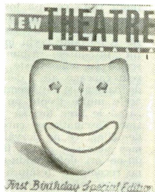
NEW THEATRE AUSTRALIA, nr. 7, septembrie-octombrie 1988