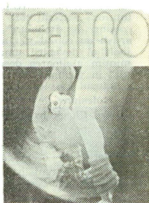
TEATRO , (Buenos Aires, Argentina), nr. 36, august 1988