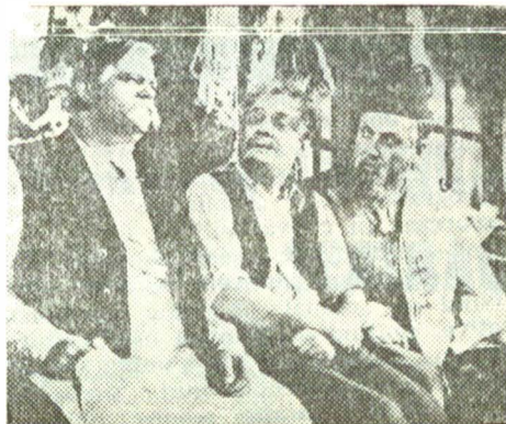
Scenă din Tache, Ianke și Cadir