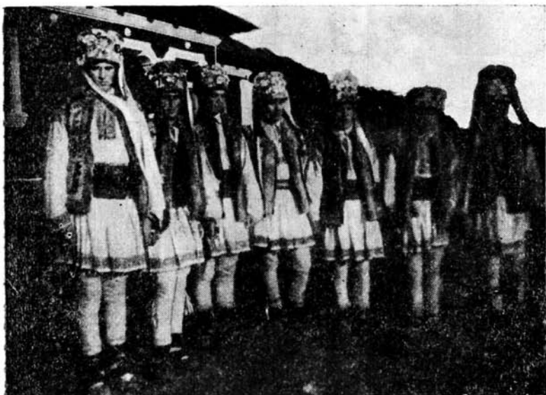
„Arnăuții” din Magapia de pe Valca Cracăului negru — 1960

N-ați văzut n-ați auzit De-un oltean de un mislean de un hoț de căpitan, ce-i zice Iancu Jian ?