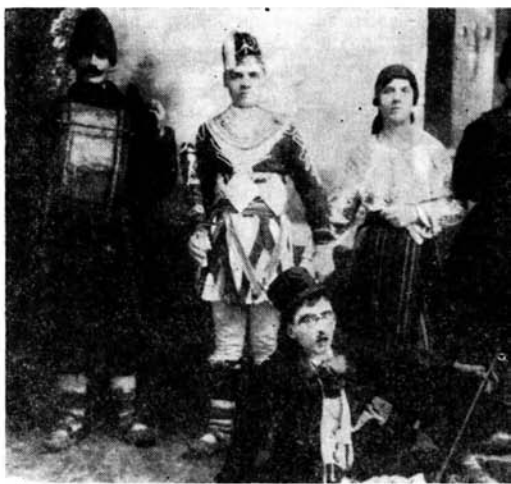
▲ Un arnăuț, fata din baletul „Arnăuții” și cei doi muzicanți (Tg. Neamț)