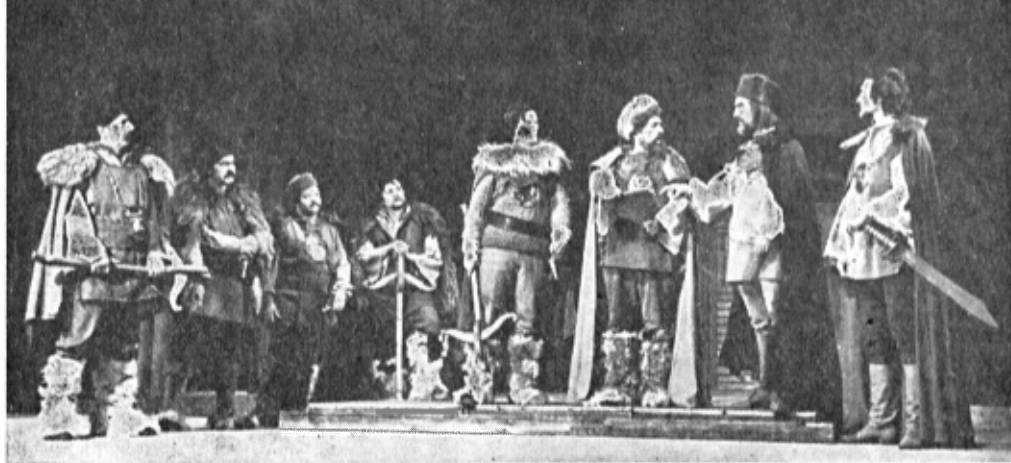
Scenă din spectacolul cu piesa „Steaua Zimbrului” de Valeriu Anania

Diferite ca problematică și stil, cele două reprezentații se însoțesc în spirit sub semnul misiunii sociale — al afirmării unui înalt ideal politic și moral. Ambele se înscriu, de asemenea, în zona dramelor eroice, a evocărilor patetice și de vibrație poetică, de sublime gesturi umane. Termenul „eroic” dobândește aici mai mult decât greutatea unei semnificații categoricale. Ne place să credem că s-a încercat o direcționare în natura însăși a programului teatrului, a „politicii” sale, a rolului pe care și-l asumă băimărenii în educarea patriotică a publicului pe coordonate majore. Scrutate dintr-un anumit punct de vedere, cele două texte, atât de diferite ca formulă dramatică, dezvăluie, în adevăr, o relație interioară comună: personajele create de Valeriu Anania exprimă — pe fundalul nimbărilor în legendă al întemeierii Moldovei — aspirația spre libertate și independență națională a poporului nostru, iar eroii lui Hemingway — în alt timp (istoric) și pe alte meleaguri — evocă aceleași aspirații, pe fundalul luptelor poporului spaniol împotriva fascismului. Ambele spectacole sînt animate de încrederea popoarelor în steaua libertății și a demnității lor, de eroismul și măreția luptelor pentru neafrnare.