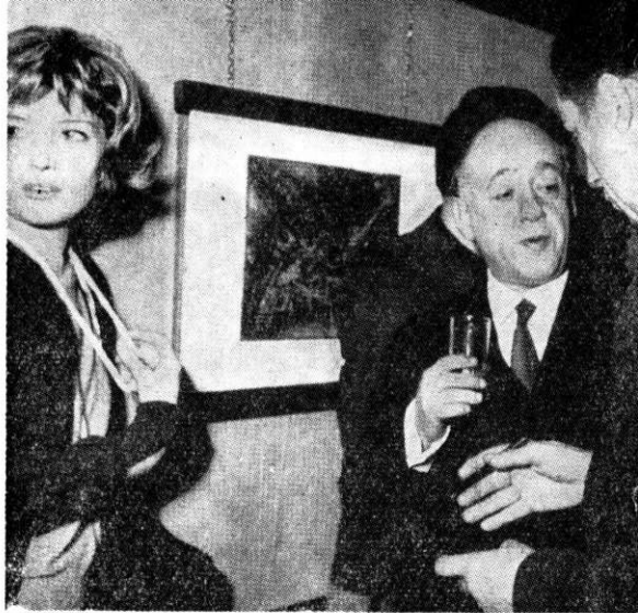
Roma : cu Monica Vitti, la un cocktail după o lectură a piesei „Lecția“