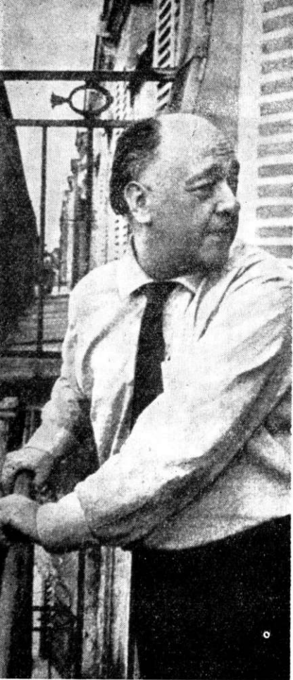
„Sous les toits de Paris“...