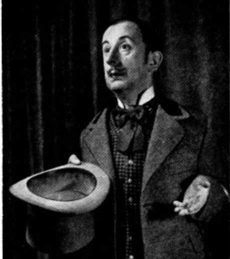
Brînzovenescu în „O scrisoare pierdută” de I. L. Caragiale

blic care nu înțelegea o iotă din graiul nostru, în secunda aceea s-a produs miracolul: lumea a rămas pe loc, sub umbrele și ziare, subliniind fiecare vorbă a lui cu hohote de rîs și tunete de aplauze. Atunci, în acea seară memorabilă am văzut, am trăit în prezența unui actor de o imensă forță de penetrație și de impresionare a publicului.