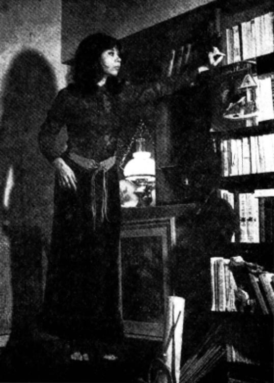
Shakespeare și Dostoievski