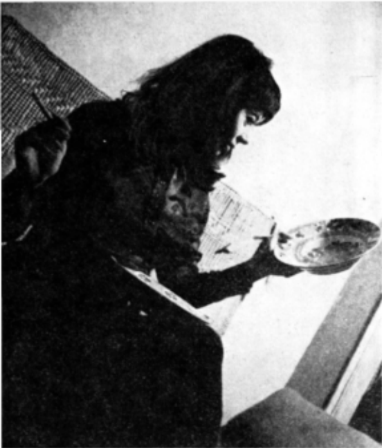
Să călătorească mult, mult...