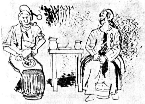
Herbert Sandberg : schiță la „Mutter Courage“

Nu dobîndește însă cunoașterea oamenilor Cel ce se observă numai pe sine. Prea multe Își tăinuiește chiar el sie însuși. Și nimeni nu-i pare Mai mintos decît el însuși.