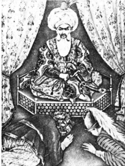
Sultan pe tron

MAHOMED : Locotenente, pe ce urme cale cu acuma ?