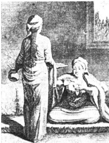
Scenă dintr-un harem