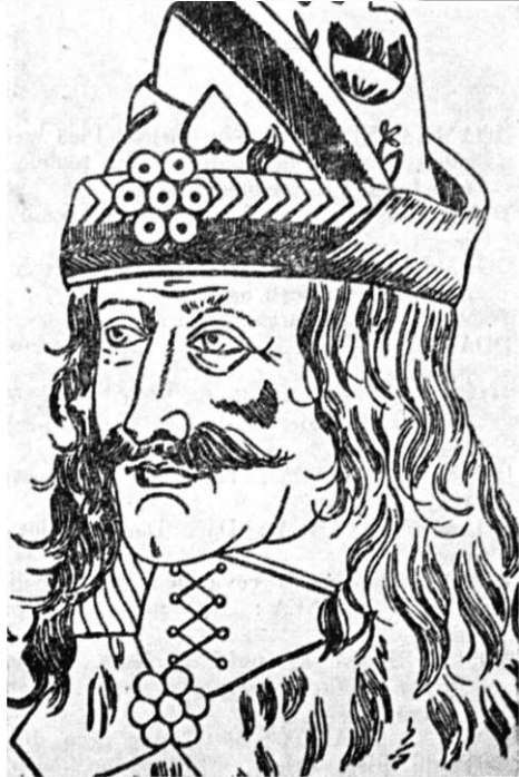
Vlad Tepeș, gravură germană din secolul XV.

SAFTA : Acum doi ani i-am biruit pe ăilalți la Popești și tot așa... de fiecare dată ră- nit și răcit, și tot ventuzele, săracele, v-au