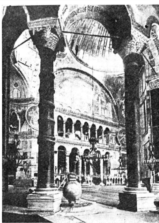
Constantinopol, Sfînta Sofia, interior