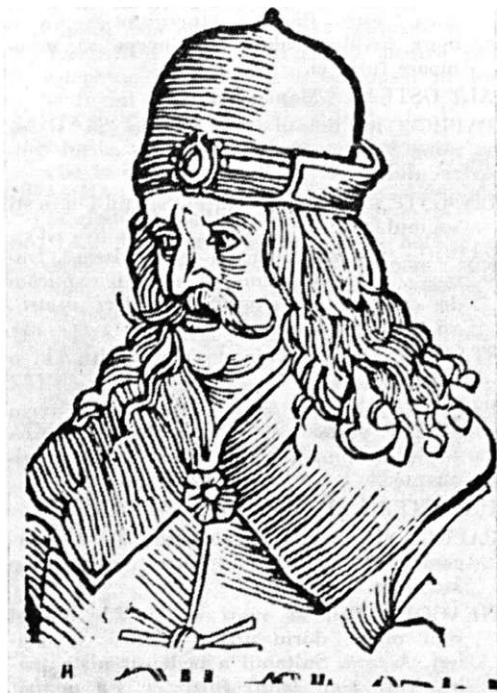
Vlad Țepeș, după o gravură germană contemporană domnitorului

UN OSTAȘ: S-o fi-mpiedicat de vreun butoi.