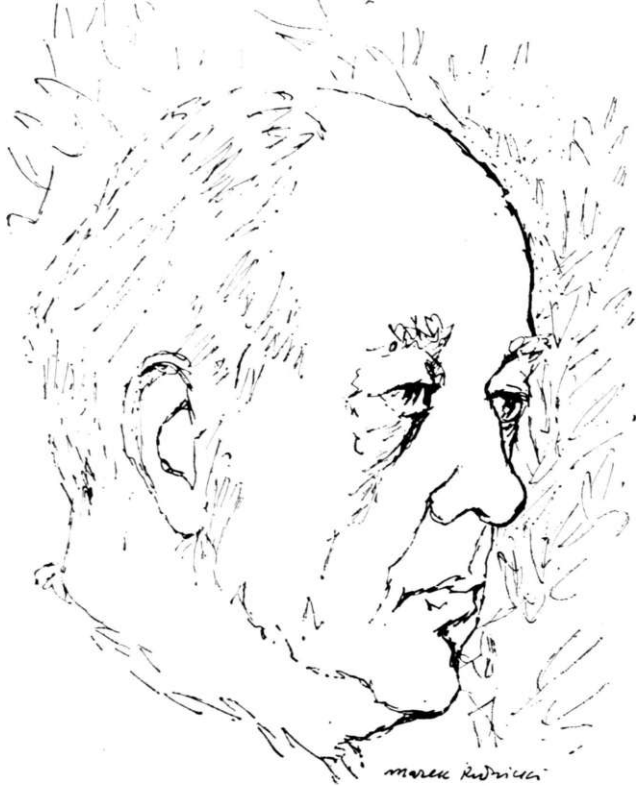
Eugen Ionescu.

descifreze, iar nu dușmani sau indiferenți; obiectivitatea este nesigură. Teoriile literaturii sînt insuficient sau nicidecum științifice, în ciuda eforturilor unor critici de astăzi care repetă, în alt limbaj, erorile lui Taine și ale lui Brunetière. Totul nu e, de fapt, decît subiectivitate“. Nu e de mirare că Eugen Ionescu pune accentul pe acest din urmă factor și că nu conține ideea de obiectivitate. A rămas pe pozițiile din cartea sa, Nu (1934), deși a evoluat sensibil și s-a lepădat de vechiul său teribilism.