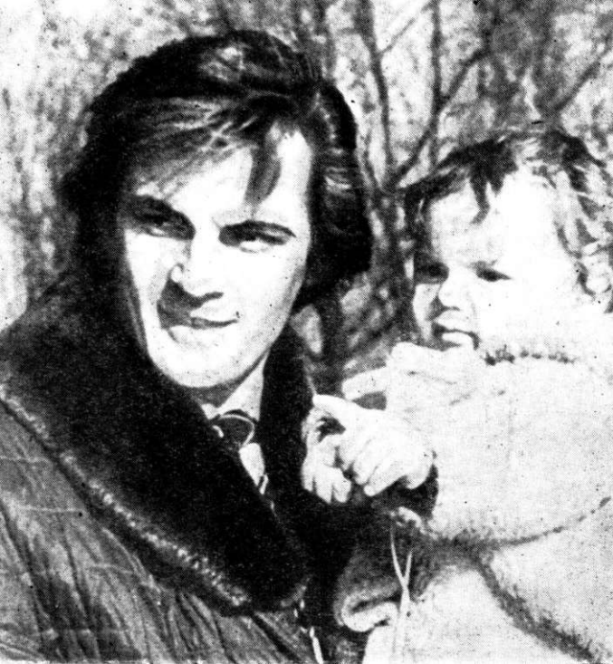
Cu Florinel Piersic, în 1970.