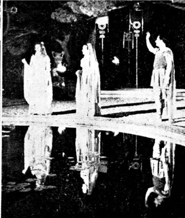
Scenă din „Visul unei nopți de vară“ și scenă din „Ifigenia în Taurida“ (în parcul Gradaț)

pădurea adormită, sub razele reflectoarelor ascunse în desișuri, actorii dau viață piesei, oferind spectatorilor imaginea unui vis autentic.