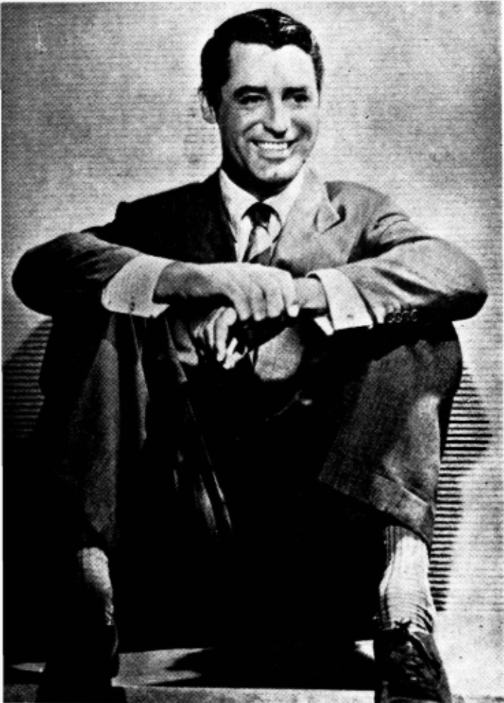
John Wayne și Carry Grant laureații premiului Oscar din acest an

Stanwick, Zarah Leander, Rosalind Russel, Debora Kerr și alții care nu-mi vin acum în minte.