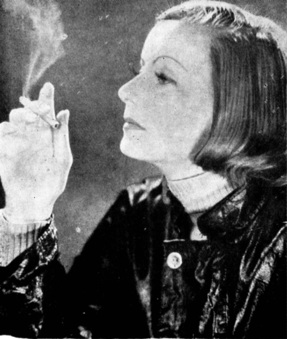
Greta Garbo: acuzatul a pledat „guilty“...

nedreptățiți. Este deci indiferent cine a fost ales. Nedreptatea e totdeauna aceeași.