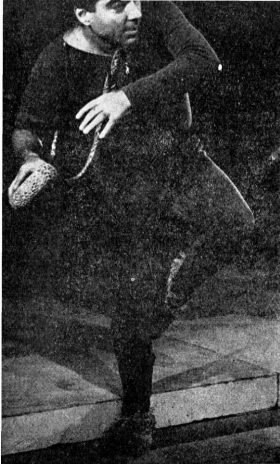
Dromio din „Comedia erorilor” de Shakespeare

Tatăl meu a fost telegrafist la C.F.R., apoi funcționar. Propozițiunea care mi-a rămas de la el era asta: „Dragul tatei, trebuie să înveți carte că eu n-am nici o avere”.