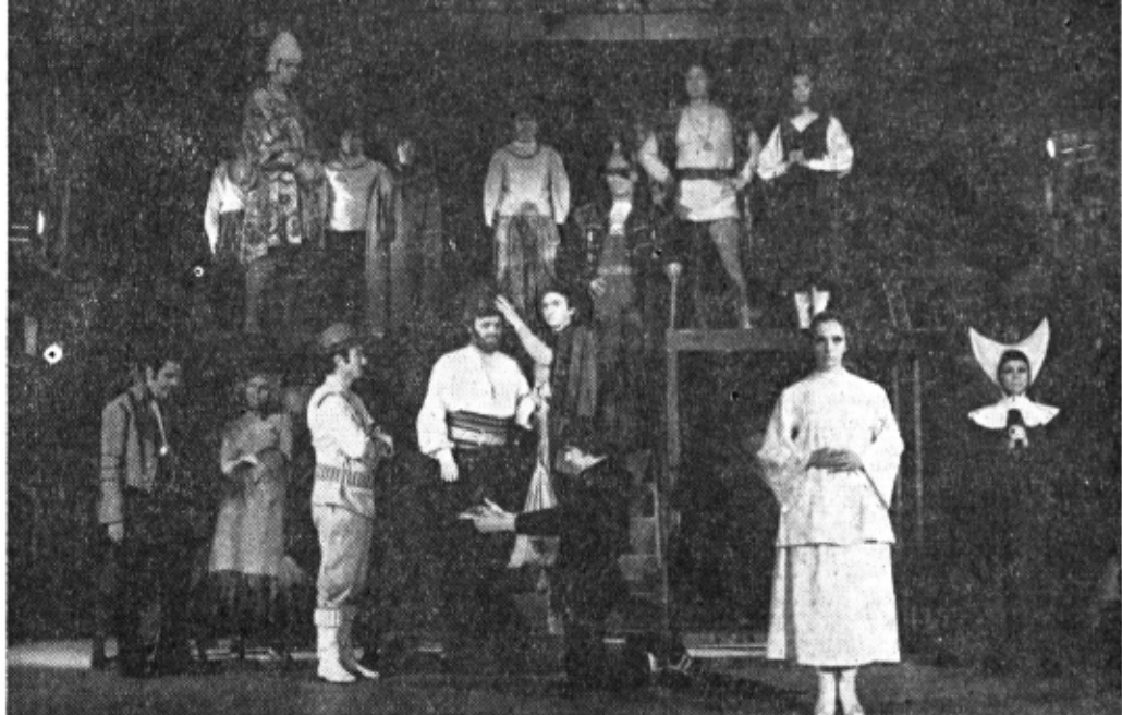
Un spectacol deschis, de afișată teatralitate, activ și activizator...