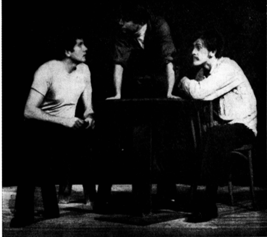
Scenă din spectacolul „Oameni și șoareci” de John Steinbeck