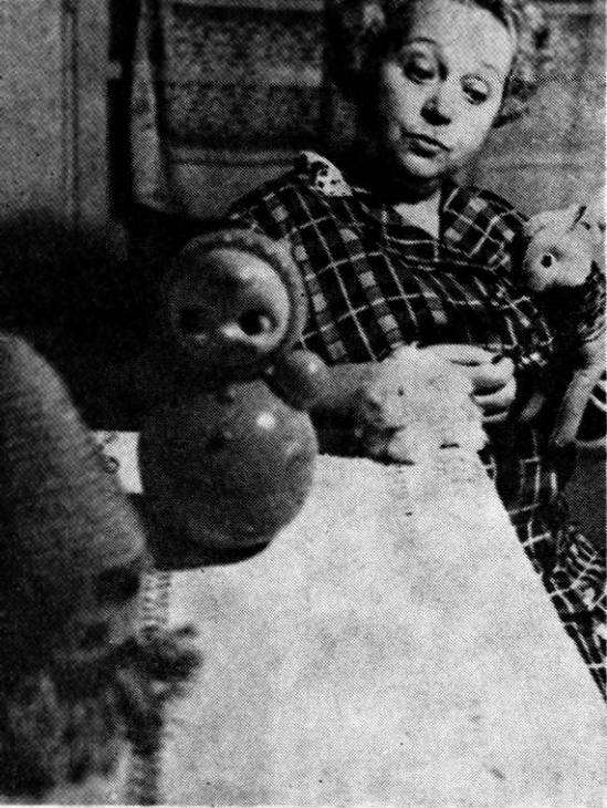
Teatrul nu e o iluzie, nici o minciună...

rit gloria cu încetul, o stăpânește cu maturitate, împărțindu-și viața între scenă și școală.