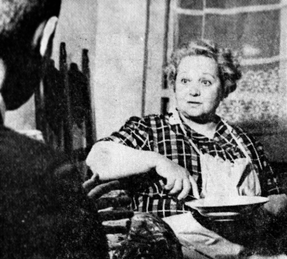
Repetițiile mă fac să nu mai am antrenament în bucătărie...

cept niciodată să repet două roluri deodată. A juca teatru nu înseamnă doar a debita niște cuvinte, a îmbrăca niște costume. N-am auzit ca cineva să fi izbutit simultan două mari creații. În cel mai bun caz, una din ele este trădată.