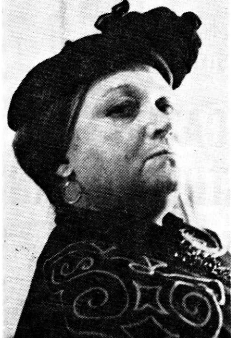
Moni mi-a pus perucă albă...