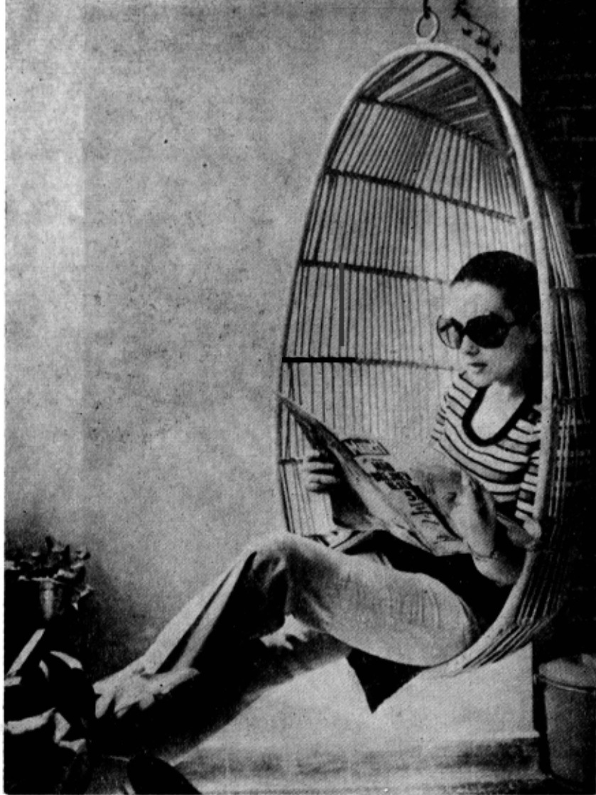
Singură pe-un balansoar...