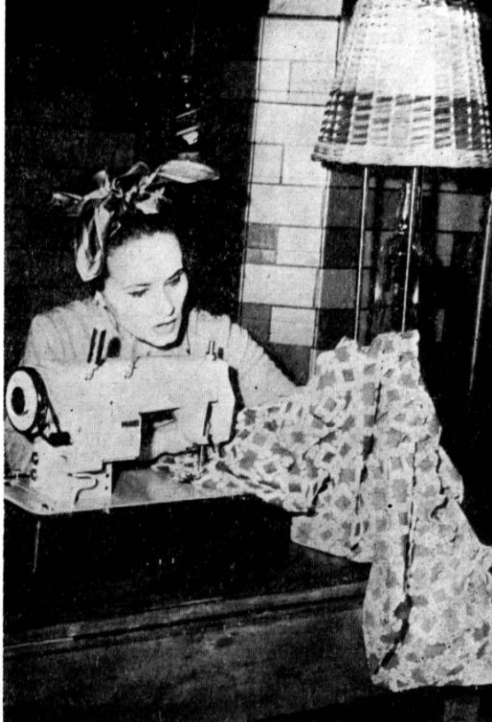
Cardin? Nu! Sînt propriul meu creator de modele.

...— Mă împac bine cu mulți parteneri comici; dintre ei, Bănică rămîne favoritul meu. La început mi-a fost frică să apar alături de el. Pentru o actriță, mijloacele de expresie comică sînt oricum mai limitate. Dar, cu timpul ne-am înțeles tot mai bine. Și publicul e bucuros să ne vadă împreună. La sfîrșitul anului vom avea un nou „show“ la televiziune.