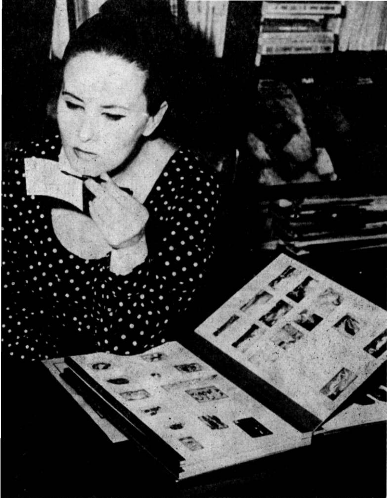
Iată un prilej de călătorie imaginară : colecția de timbre !

nu sînt destul de pregătită pentru a răspunde acestei chemări. Și nu m-am dus.