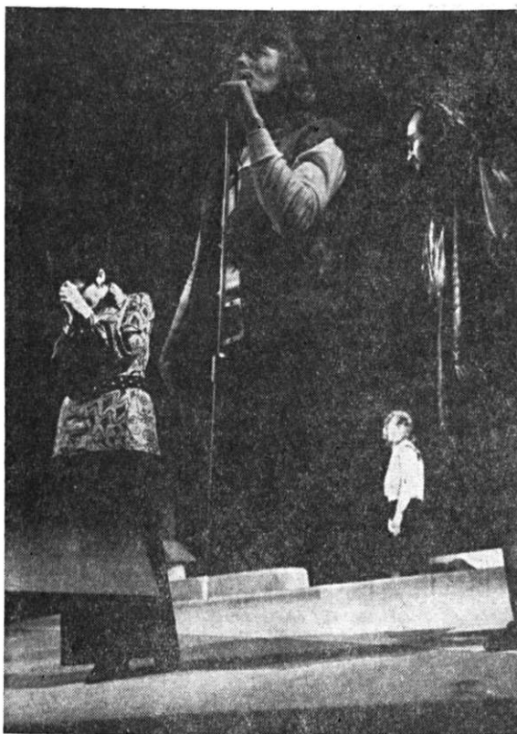
„Noile suferințe ale tinărului W” de Ulrich Plenzdorf în regia lui Szabo Ioszeľ.