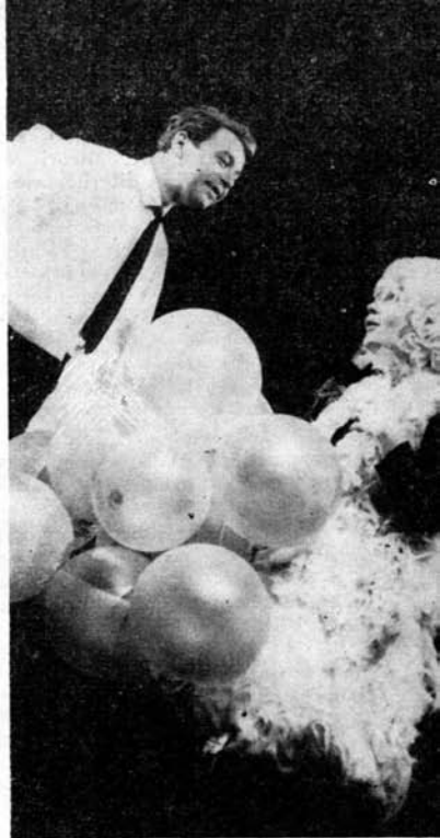
Rodica Tapalagă și Octavian Cotescu in trei momente din spectacol