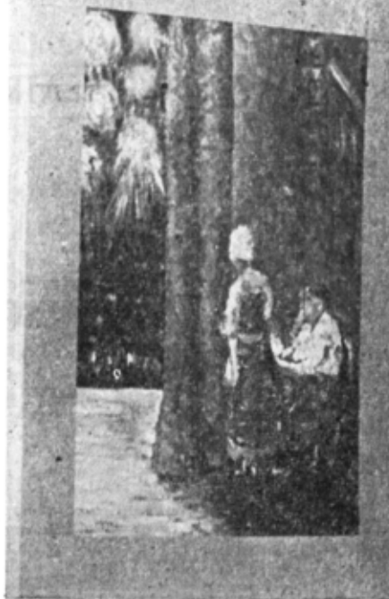
„Flori“, „În culise“ (sus) și caricatura lui St. Mihăilescu-Brăila în „Escu“ (jos) de Traian Dănceanu.

rențe cromatice de substrat și acordind tablourilor acea atmosferă ușor cețoasă, de vis, împinsă uneori pînă la zonele înfrerealului.